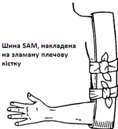
Шина SAM, накладена на зламану плечову кістку